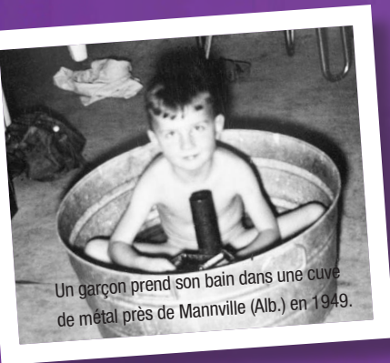
Un garçon prend son bain dans une cuve de métal près de Mannville (Alb.) en 1949.