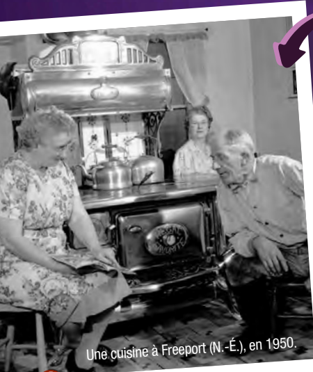
Une cuisine à Freeport (N.-É.), en 1950.