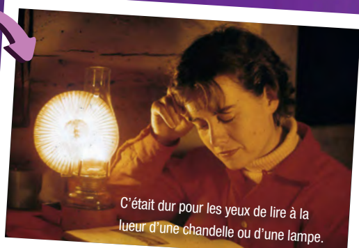
C'était dur pour les yeux de lire à la lueur d'une chandelle ou d'une lampe.

Si ta famille n'avait pas d'électricité, tu devais probablement te lever en même temps que le soleil et te coucher peu après lui. Tu devais te déplacer avec une petite chandelle ou une petite lampe qui n'éclairaient pas beaucoup. Tu devais peut-être aider à fabriquer des chandelles, à moins que tu aies la tâche salissante de nettoyer les lampes à pétrole.